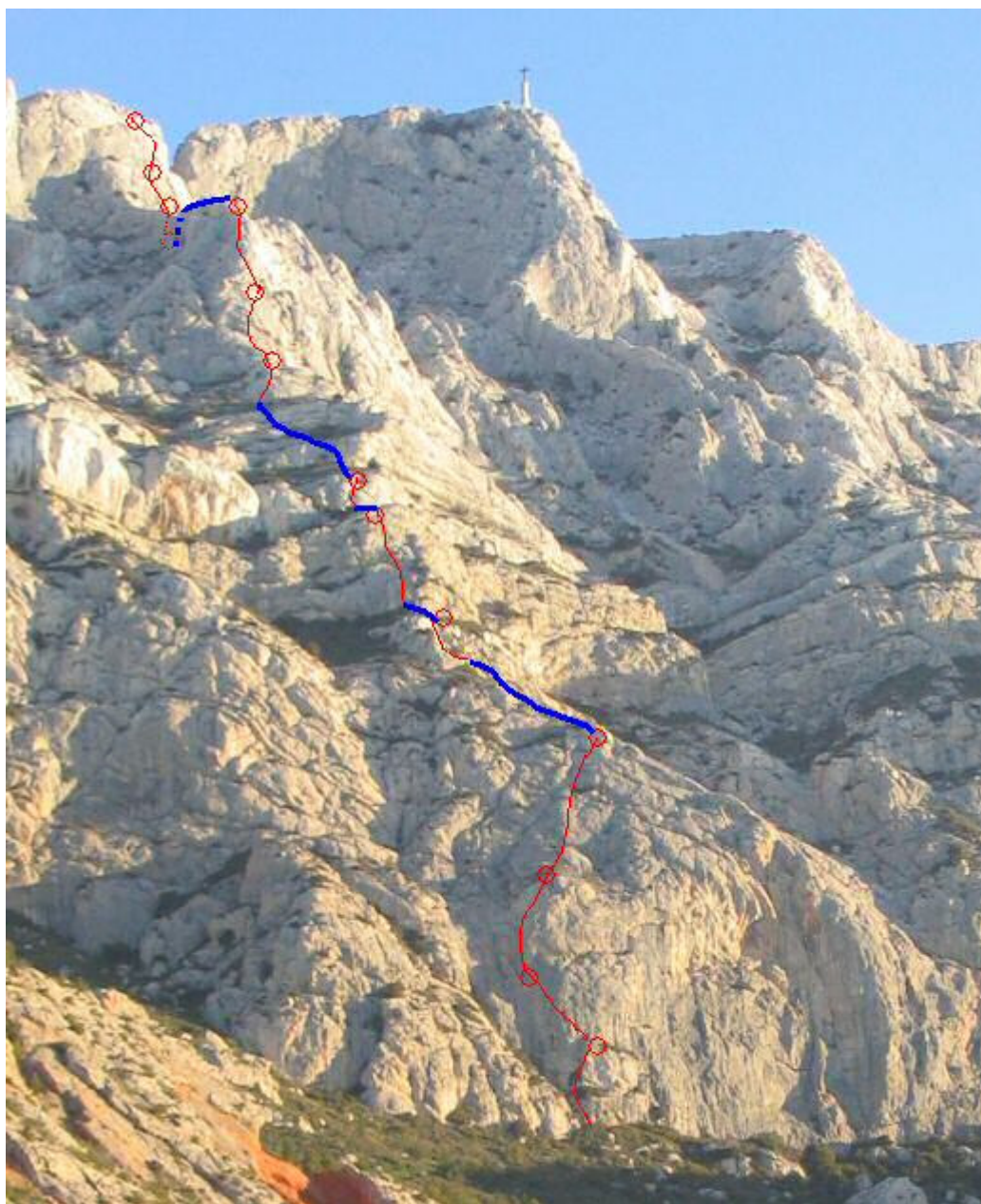
La Commande : 13 longueurs, 400 m